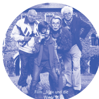
Film „Max und die Wilde“